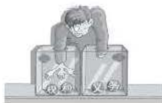
图 1 伸与缩