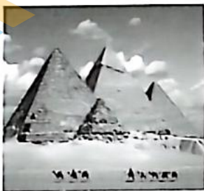
图1 孟菲斯及其墓地金字塔

材料 世界遗产往往是一个国家或者一个地区人文知识和自然知识的代表，以其资源的高价值、不可再生等特性在旅游业中独树一帜。在旅游业蓬勃发展的当今世界，世界遗产旅游也将以其独一无二的遗产资源吸引更多的旅游者，成为旅游的新热点。下面是一些国内外著名的世界遗产(或非物质文化遗产)：