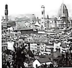
图2 佛罗伦萨历史中心