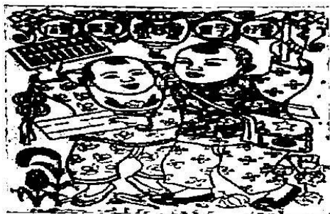
图三年画《念书好》，江辛（1944年）画图中文字为“念书好，念了书，能算账，能写信”。