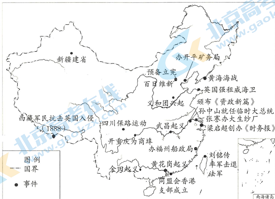
晚清时期重大历史事件(部分)示意图

结合地图中的信息和所学, 任选3个视角, 简述晚清时期中国历史的发展演变。(10分)