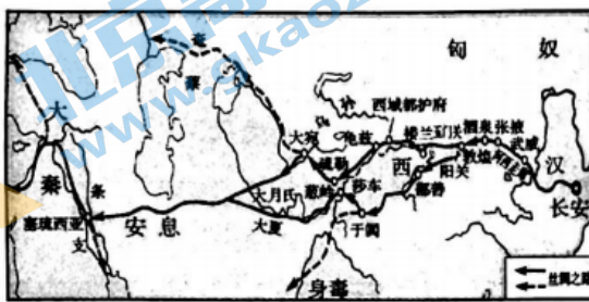
汉代丝绸之路示意图

10.下面为汉代丝绸之路和元代丝绸之路示意图。与汉代相比,元代丝绸之路的主要不同是