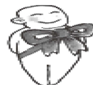
生得再平凡 也是限量版