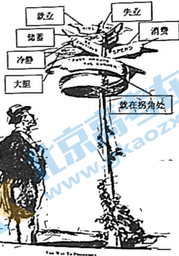
图4: 漫画《通往繁荣之路》