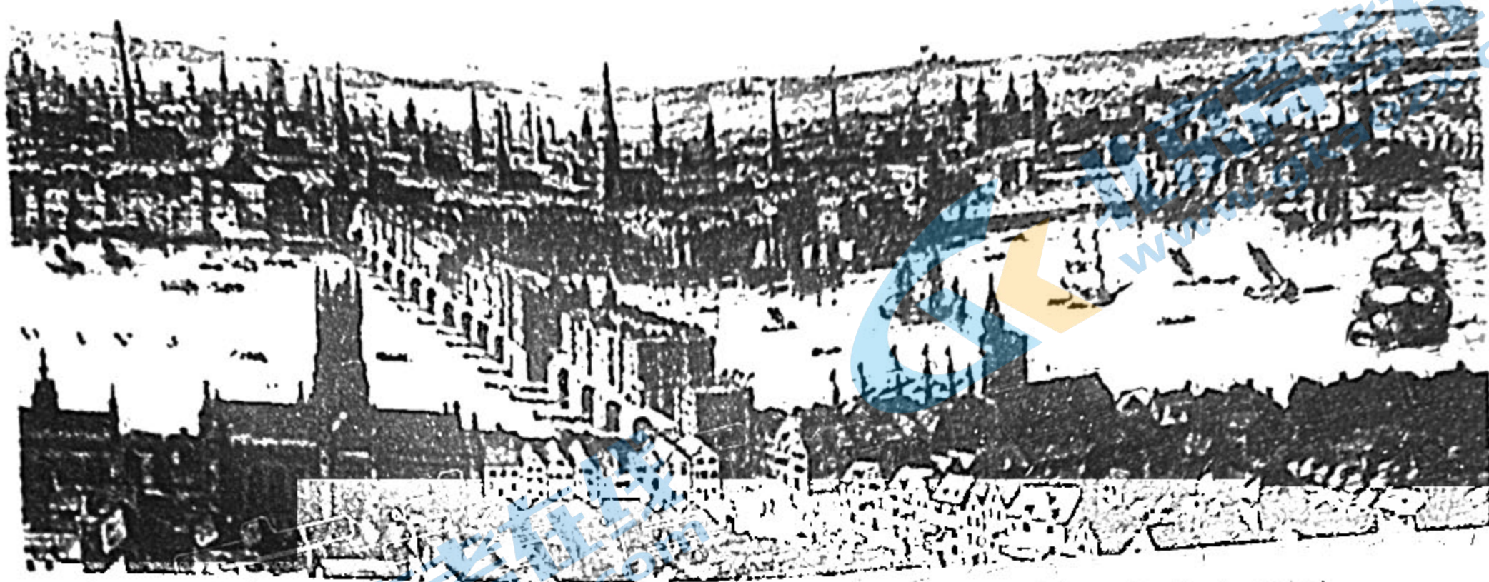
图 5: 1600 年的伦敦港(木版画)

图片说明: 16 世纪末, 伦敦港是世界贸易新轴线的中心。此前英国开展了一系列探险活动。佛朗西斯·德雷克甚至攻击了运载香料的葡萄牙大帆船及满载黄金白银从美洲返航的西班牙帆船, 并作了第二次环球航行。“商人冒险家”和船主利用发达的大西洋贸易给伦敦港提供了好机会。莫斯科维公司、皇家贸易公司、东印度公司、弗吉尼亚公司为第一个不列颠殖民帝国奠定了基础。