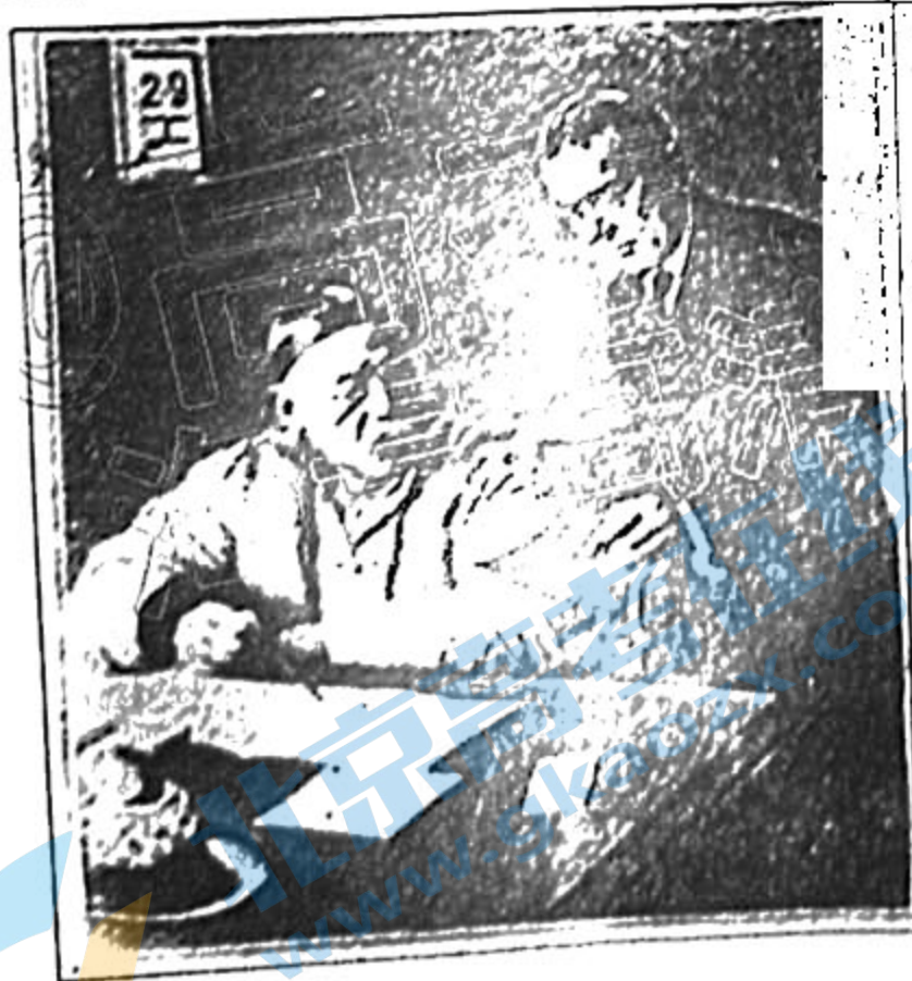
图2是1912年8月31日英国《插图伦敦新闻》封面画，图注是“中华民国第一任总统(原文如此)的政治顾问英理循博士和总统袁世凯”。英理循是澳大利亚籍英国《泰晤士报》驻华记者，当时被西方媒体誉为“舵手”“拯救中国的救星”。他后来回忆说：“许多图片新闻刊载有我的画像，最有趣的是伪造我站在袁世凯身旁并以一份文件请其过目的那张画像。这是总统和他的秘书蔡廷干的照片，不过蔡的头被我的头取而代之了。”