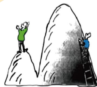
站得高望得远，可一味地好高骛远就什么也看不见。

7. 南唐后主李煜在《相见欢》中写道：“剪不断，理还乱，是离愁，别是一般滋味在心头。”用丝喻愁，新颖而别致。前人以“丝”谐音“思”，用来比喻思念。李煜用“丝”来比喻离愁，别有一番新意。这表明