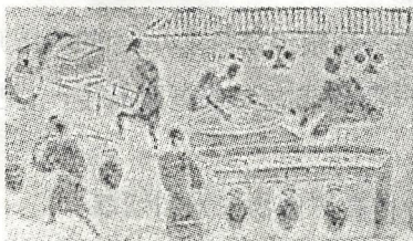
东汉酿酒画像砖拓片