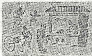
东汉酒肆画像砖拓片

在四川地区汉墓出土的石刻中,有许多酿酒、羊尊酒肆的画像砖,宴饮宴乐的陶俑,还有带有酿酒场景的庖厨画像石。