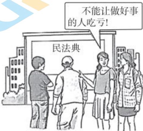
做好事有法律保障

29. 我国民法典规定：“因保护他人民事权益使自己受到损害的，由侵权人承担民事责任，受益人可以给予适当补偿。没有侵权人、侵权人逃逸或者无力承担民事责任，受害人请求补偿的，受益人应当给予适当补偿。”“因自愿实施紧急救助行为造成受助人损害的，救助人不承担民事责任。”