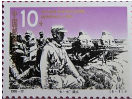
抗日战争纪念邮票

1. 某学校拟创办一主题网站，纪念一项重大的活动。根据下列图片判断其主题应是（ ）