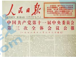
十一届三中全会公报