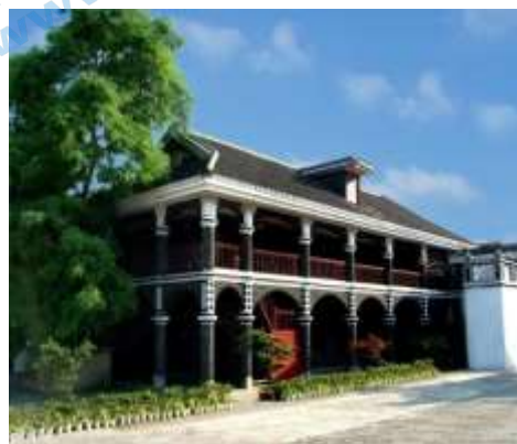
图三主题：走向成熟 地点：贵州遵义