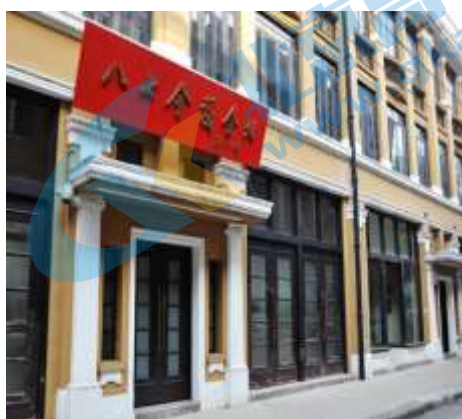
图二主题：重要转折 地点：武汉市汉口鄱阳街 139 号