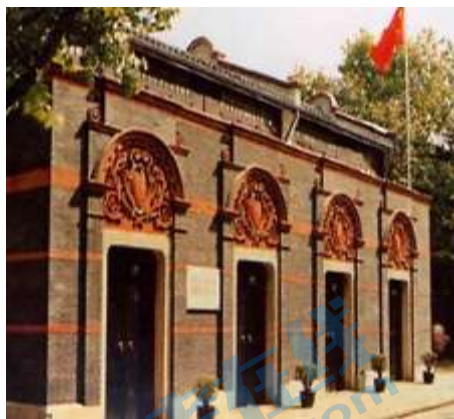
图一主题：开天辟地 地点：上海（原）望志路 106