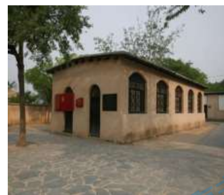
图四主题：新中国从这里走来 地点：河北平山县西柏坡①

注：①1948 年党中央移驻西柏坡，“西柏坡是党中央毛主席进入北平解放全中国的最后一个农村指挥所”。