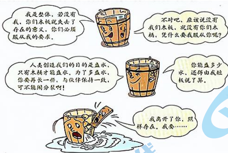
木桶和木板的对话