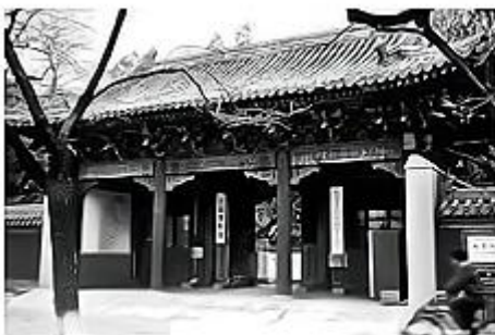
首都博物馆旧馆（北京孔庙）