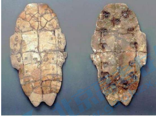
殷墟出土刻有文字的龟甲正反面