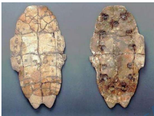
殷墟出土刻有文字的龟甲正反面