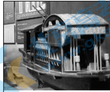
1921年，中国共产党第一次全国代表大会召开地浙江嘉兴南湖上的红船（模型）