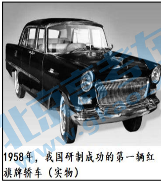
1958年，我国研制成功的第一辆红旗牌轿车（实物）