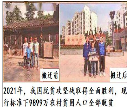
2021年，我国脱贫攻坚战取得全面胜利，现行标准下9899万农村贫困人口全部脱贫

依据材料，从上述展品中为四部分展览各选择一件对应的展品（也可以推荐其它展品），并从中任选一件，结合所学分析该展品对体现所属部分主题的价值。（11分）