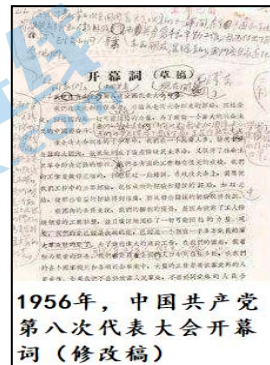
1956年，中国共产党第八次全国代表大会开幕词（修改稿）