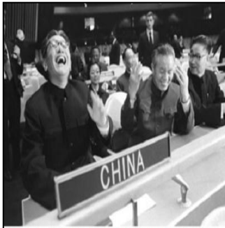
1971年，中华人民共和国代表首次出席联合国大会