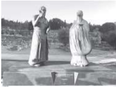
青铜组雕作品《神遇》