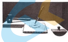
中国人世的签字台笔