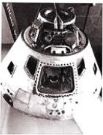
神舟十二号返回舱

3. 北京展览馆的“奋进新时代”主题成就展上，6000 多项展览要素生动诠释了十八大以来党和国家发展进程中极不寻常、极不平凡的 10 年。下列选项中，适合作为该展览展品的是（ ）