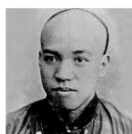
1898. 6. 11 资产阶级立宪派 戊戌变法(103天)