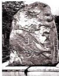
“精准扶贫”的地标石