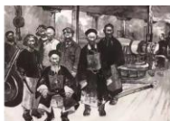
1861—1895 地主阶级洋务派 洋务运动