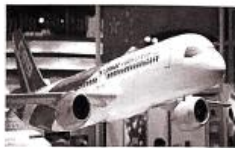
国产大飞机 C919 的模型