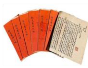
1901—1911 封建统治阶级 清末新政