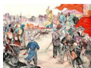
1851—1864 农民阶级 太平天国运动