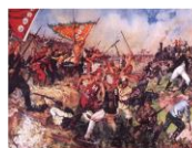
1899—1900 农民阶级 义和团运动