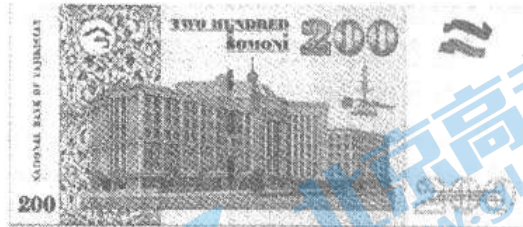
塔吉克斯坦索莫尼：塔吉克斯坦国家图书馆