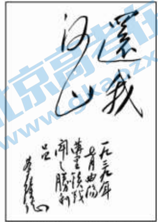
D. 还我河山 (聂荣臻)