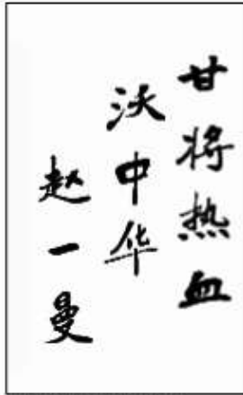
B. 甘将热血沃中华 (赵一曼)