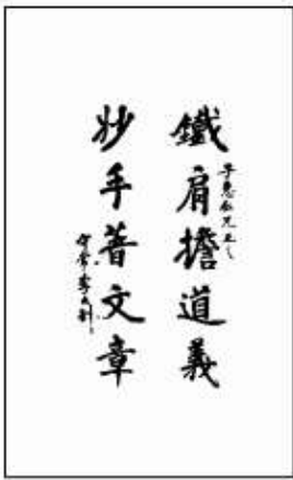
A. 铁肩担道义，妙手著文章 (李大钊)