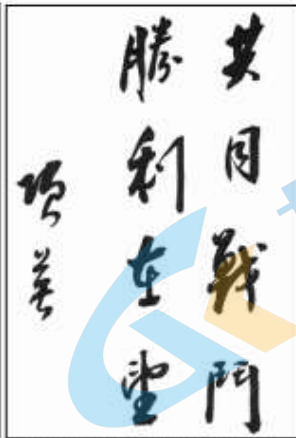
C. 共同战斗，胜利在望 (项英)