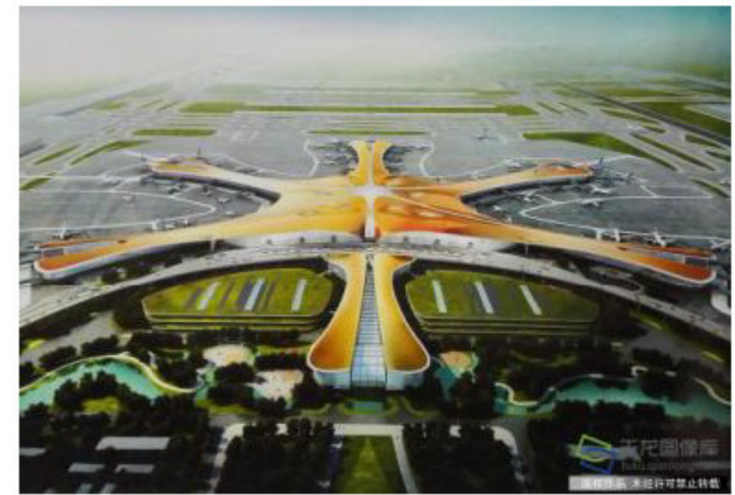
大兴新机场“凤凰展翅”