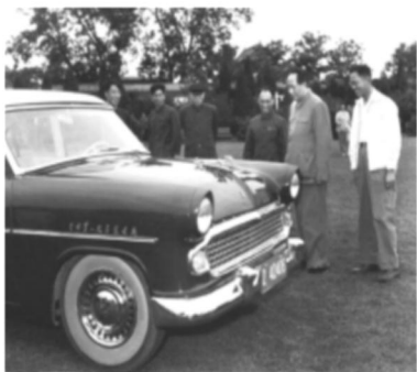
1958年5月,毛泽东在中南海观看新中国制造的第一辆小轿车—“东风”牌小轿车