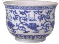
明正德青花仰钟式碗

29. 元代，丝绸之路商贸往来频繁，阿拉伯地区盛产的钴料进入中国，配合景德镇的高岭土，色泽明丽的青花瓷器诞生了。珍藏在北京故宫博物院的“明正德青花仰钟式碗”（见右图）就是一种以缠枝花衬托阿拉伯文作为装饰纹样的官窑青花瓷器。对此，下列理解正确的是