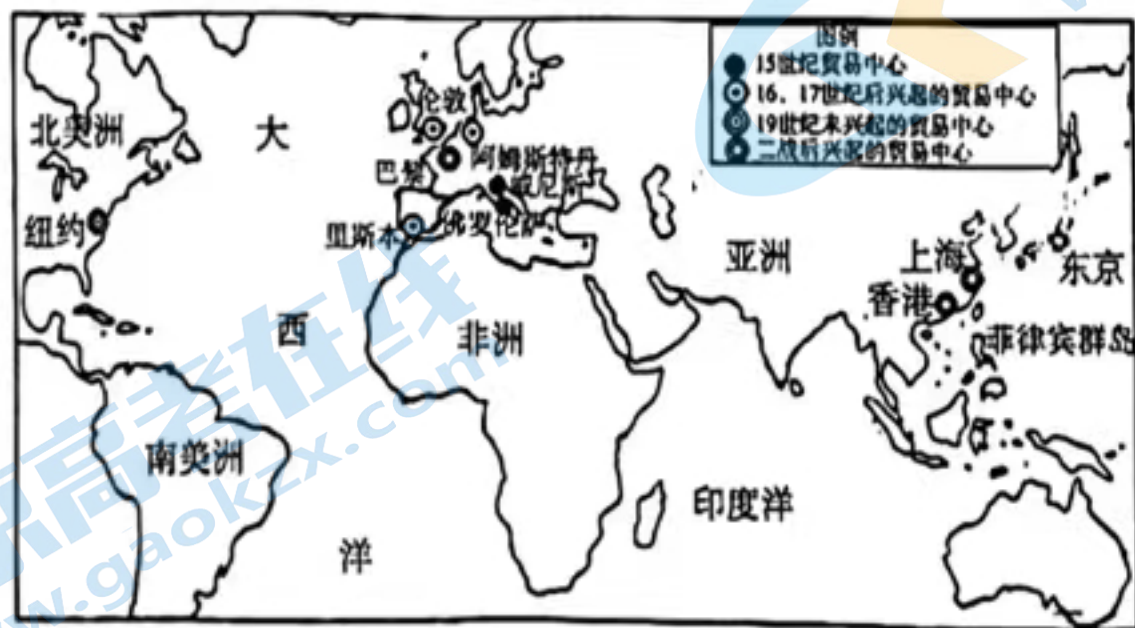
国际贸易中心演变示意

国际学术界根据国际贸易中心城市的辐射力和吸纳力等综合影响力,将其分为全球性国际贸易中心城市和区域性国际贸易中心城市的两大类。