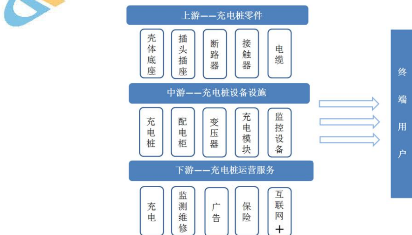
图2：新能源汽车充电桩产业链结构

注：充电机、充电模块为充电核心设备，占充电设施总成本的45%-55%。打造一个充电站的投资成本为250万元，转换设施成本在160万元左右。