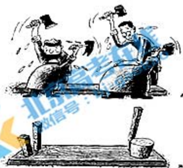
图1 组装 作者巫德华

10. 《汉书·枚乘传》中有“泰山之溜穿石, 单极之纆断干。水非石之钻, 索非木之锯, 渐靡使之然也”的说法, 意思是, 泰山的滴水能滴穿岩石, 细细的井绳可以磨断井上的栏杆。水并不是给石头打眼的钻子, 井绳也不是用来拉开木料的锯子, 是日久天长不停地摩擦才使它们这样的。这段话在今天的现实意义是