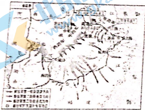
A. 人民解放军渡江战役示意图