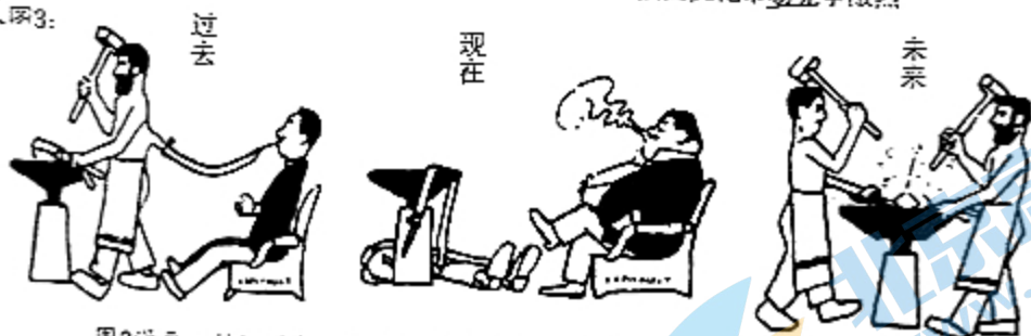
图3漫画: 拉培兰加, 《过去, 现在, 未来》(有引号), 意大利, 1898年