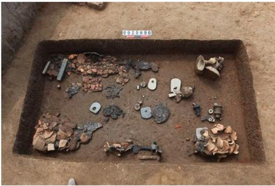
江苏省东山村遗址（距今近 6000 年前）

16. (10 分) 文明起源与国家产生，是人类历史上最重大事件之一。但对于以中国为代表的东方古代文明的起源和早期发展，在相当长时间里，既缺乏资料，也缺乏系统的认识。