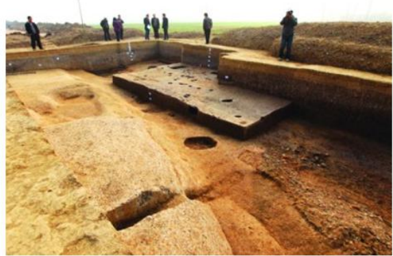
安徽凌家滩遗址（距今约 5000 多年前）

考古学家发现高等级大墓和小型墓葬共存、分区埋葬的现象；大墓中发现多件石钺、石铎等仪仗武器。