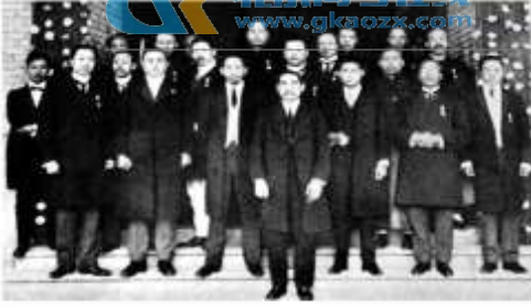
1912年1月1日，孙中山在南京宣誓就任 中华民国临时大总统