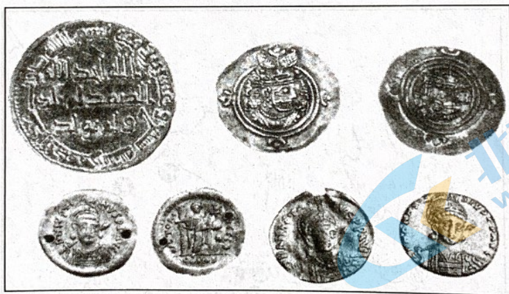
图 2 唐代墓葬出土的波斯、阿拉伯、东罗马金银币图