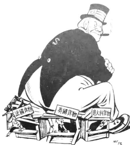
图2：《“窒息的”英、法、意市场》（20世纪

内容描述：云端之上的西风神（ERP，马歇尔计划缩写）正鼓起腮，向寓意欧洲法国货物、意大利货物的货摊上，将货摊压得（Europe）的大风车吹来劲风，大风车转动几乎倒塌。该漫画的意图是说明美国垄断资本起来，驱散了欧洲的严寒，大风车周围呈趁它的竞争者衰落的机会，在战后夺取了世界市场的一大部分。