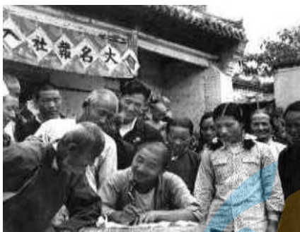
②农民申请加入合作社