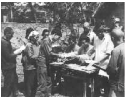
①农民领取土地承包合同书