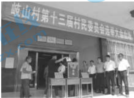
④岐山村第十三届村民委员会选举大会