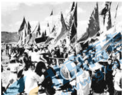
③庆祝中国第一个人民公社成立