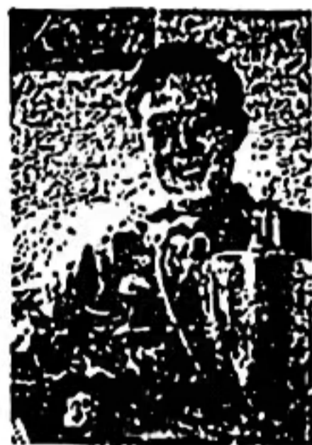
图 3 《人民日报》1959年6月1日(11)封面

10. 1959年春天,出生于广东省中山县南屏镇的容国团在世乒赛男单决赛中夺得新中国在世界体育比赛中第一个世界冠军,其照片登上《人民日报》封面(见图3)。周总理将容国团夺冠和十年国庆视为1959年两件大喜事,将中国首次生产的乒乓球命名为“红双喜”,乒乓球热随之迅速风靡全国。