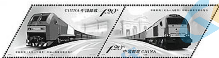
中欧班列（义乌—马德里）特种邮票

38. 中欧班列横跨亚欧大陆，它不单是运输货物的载体，还是一个通过改善基础设施、加快互联互通带动沿线地区开发、带动投资方向，从而实现产业贸易和投资一体化发展的整体计划。这表明（ ）