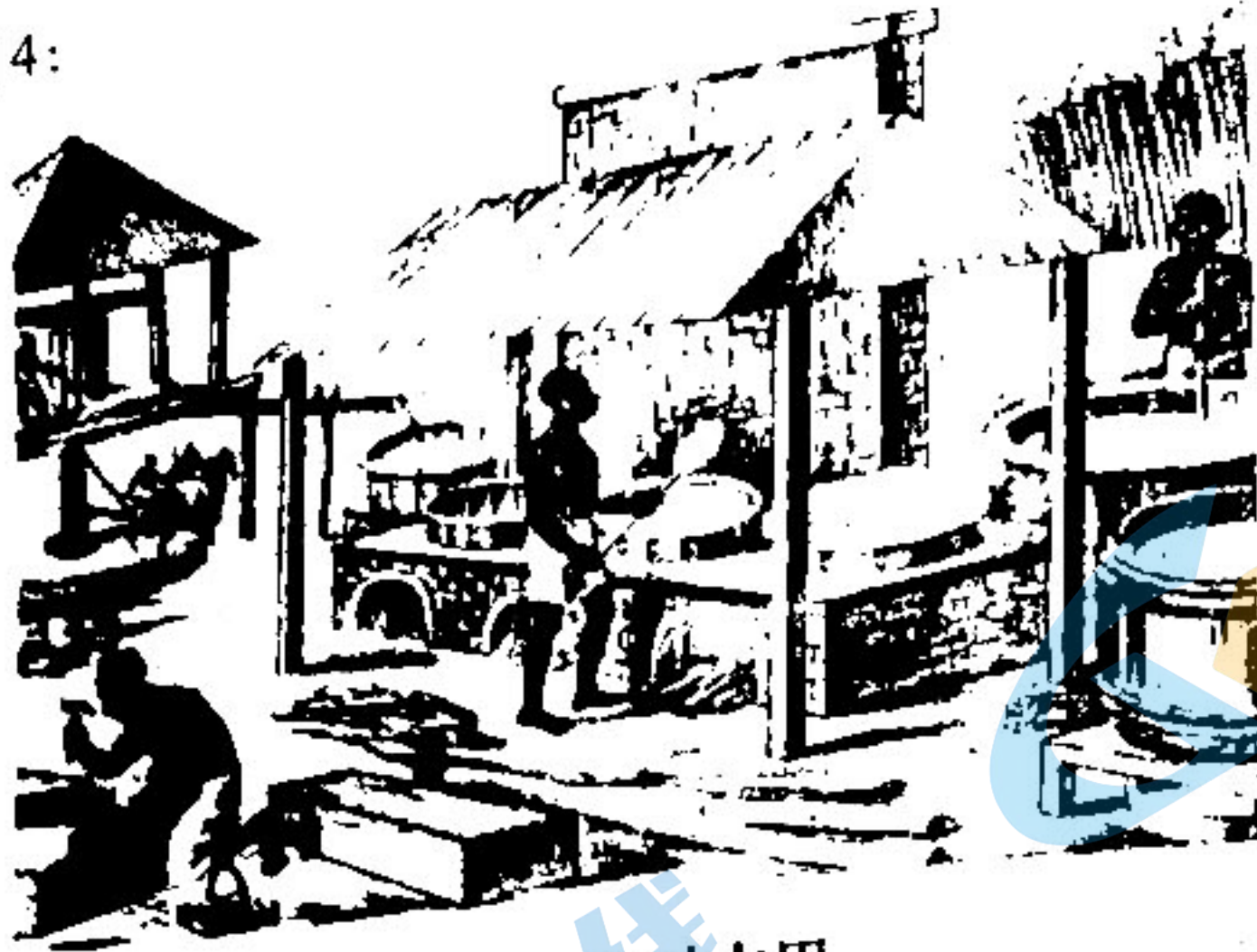
图 4: 1840 年古巴的一幅画。画的右上角是甘蔗林。