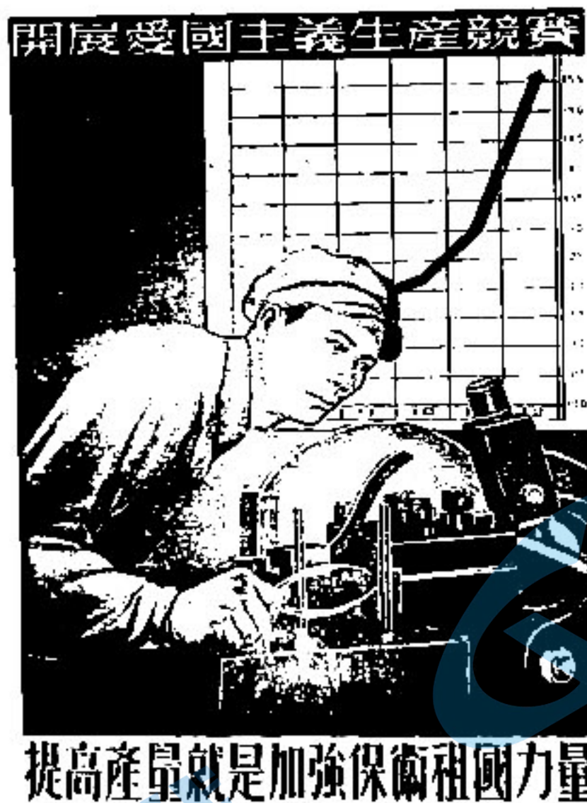
图 5: 张凡夫《提高产量就是加强保卫祖国力量》宣传画(1951年)

(1) 根据材料一并结合历史背景,简述 20 世纪 20-60 年代苏联社会主义劳动竞赛的演变。(8分)