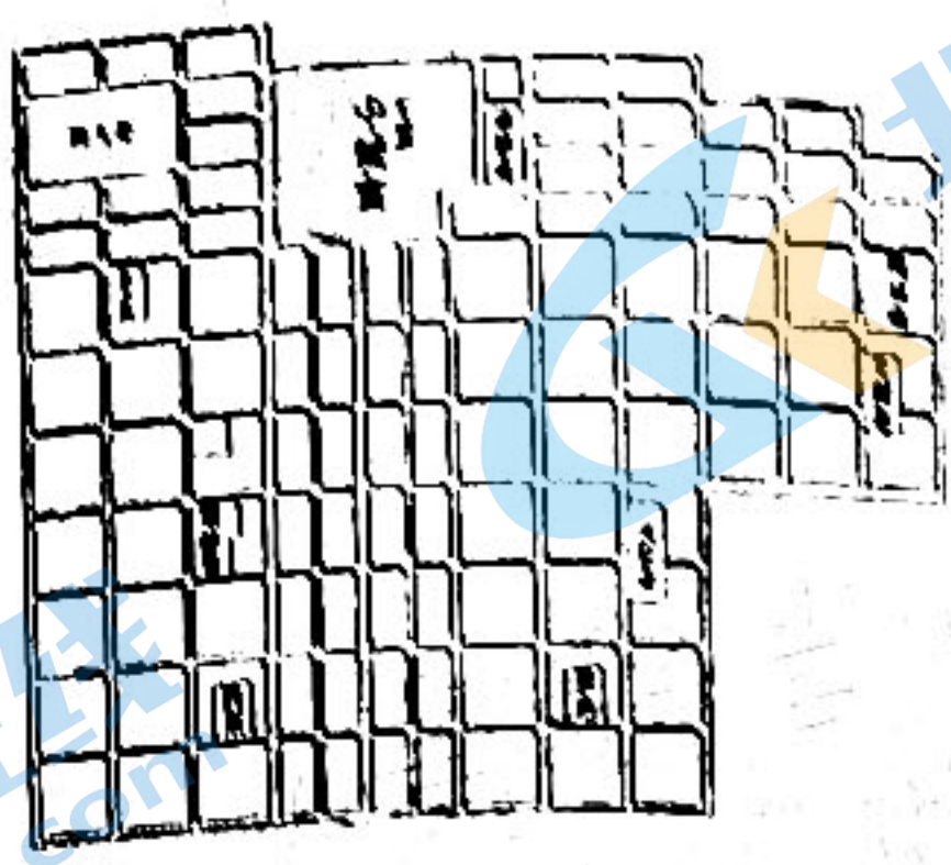
图2: 八世纪初日本平城京平面图