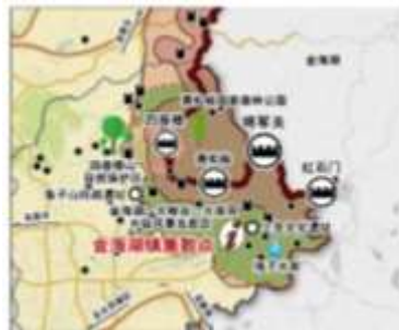
马兰路组团资源分布示意图