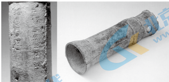
至顺三年铜炮（1332年）收藏于中国国家博物馆

上图的铜炮是世界上现存最早有纪年可考的金属管形火器，是当时火药武器的典型代表。炮身外壁纵向刻有铭文“至顺三年二月十四日 绥边讨寇军第三百号 马山”。由此可知，该炮制造于元朝至顺三年，是同一类别产品中的第300号，可见当时火炮生产和应用的规模。