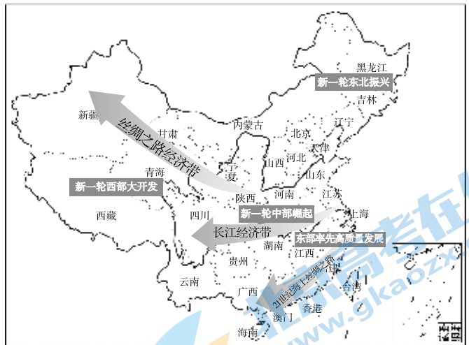
区域协调发展战略体系

材料二 2000年中共中央实施西部大开发战略。不断加大投入力度，青藏铁路、西气东输、西电东送、水利枢纽等一批标志性工程相继建成并产生效益，完成了“送电到乡”“油路（柏油路）到县”等建设任务。2000—2013年，西部地区全社会固定资产投资年平均增长比东部地区快4.6个百分点。2012—2018年，西部地区生产总值平均增速高出全国增速1.8个百分点。十八大以来，加强区域发展与“一带一路”建设对接，积极构建东西南北纵横联动的区域经济新格局，形成优势互补，引领区域经济高质量发展。