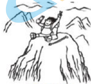
所谓光辉岁月 不仅是登顶成功之后的光彩夺目 还有路途之中咬紧牙关的坚持