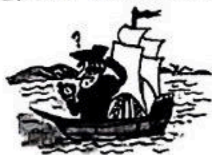
发现新世界的人 刚开始都是走错了路