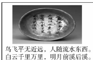
鸟飞平无近远，人随流水东西。 白云千里万里，明月前溪后溪。

26. 中国共产党人的“精神谱系”由一个个鲜明具体的“坐标”组成。恽代英的名言是：“好人是有操守的，好人是有作为的，好人是要能够为社会谋福利的。”罗登贤的名言是：“什么也不能动摇我，我将我的生命给我们的党与人民大众。”由此可见，