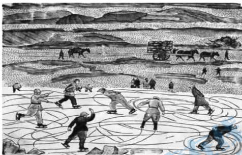
延河溜冰 刘岷 版画/9.6×11.1cm/中国美术馆藏

我从未见过正阳,但我 喜欢看木刻。刘岷同 志在延安时间不久,已有了许多作品,希望继续努力, 为创造中华民族的新艺术而 奋斗!