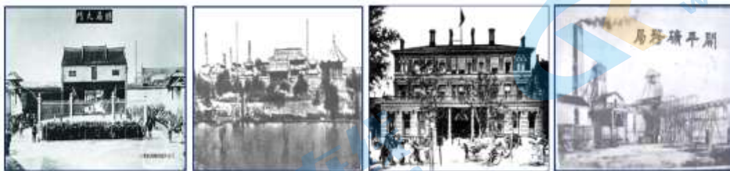
江南机器制造总局