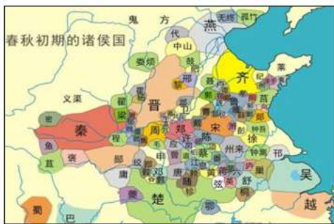
图 1 春秋初期形势图