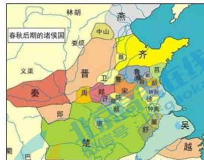
图 2 春秋末期形势图