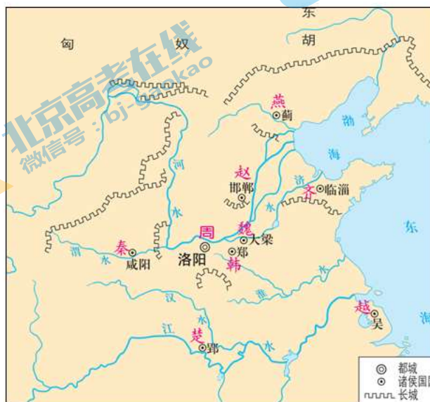
图 3 战国形势图