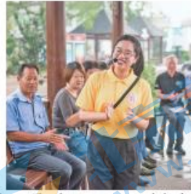
浙江衢州“8090”（青年）理论宣讲团成员进行宣讲