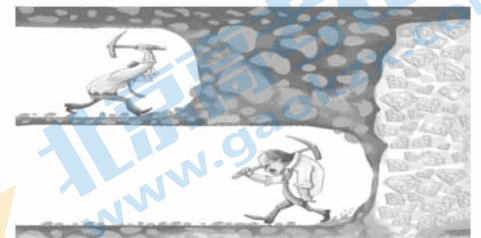
别放弃,再坚持一下就到成功彼岸!