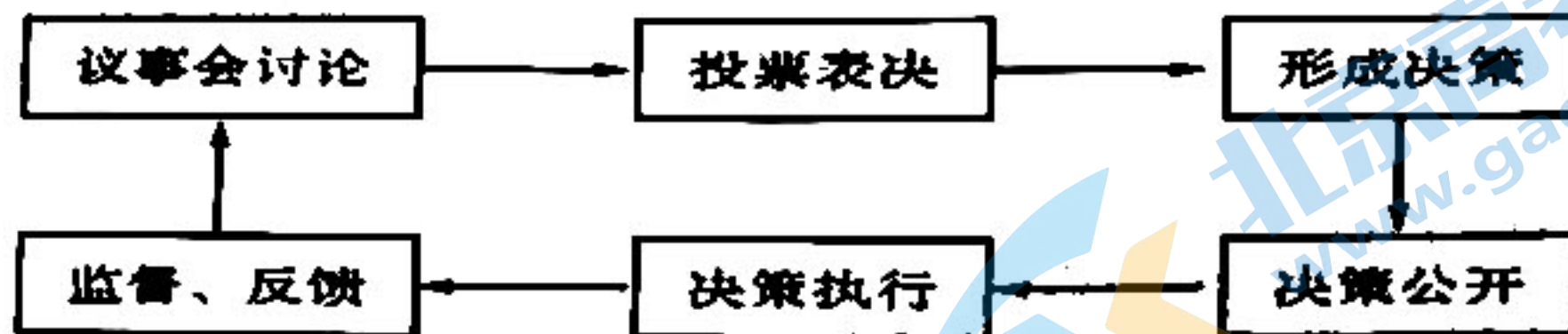
蕉岭村民协商议事会的决策程序示意图

4. 梅州市蕉岭县在村民代表会议基本制度基础上，创设村民协商议事会，并形成了一套成熟的议事规则，借助议事规则让会议有效开展，保障了村民参与村级公共事务的管理权和决策权。根据下图，这一决策程序