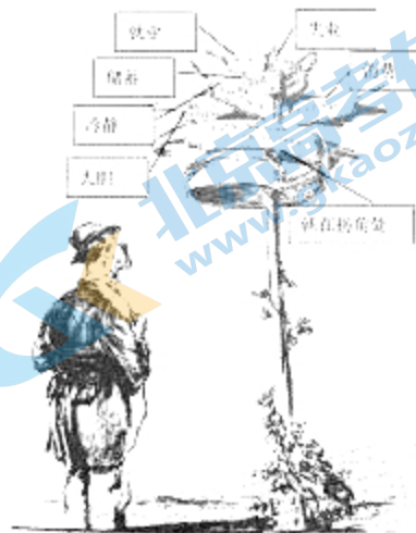
图4：漫画《通往繁荣之路》