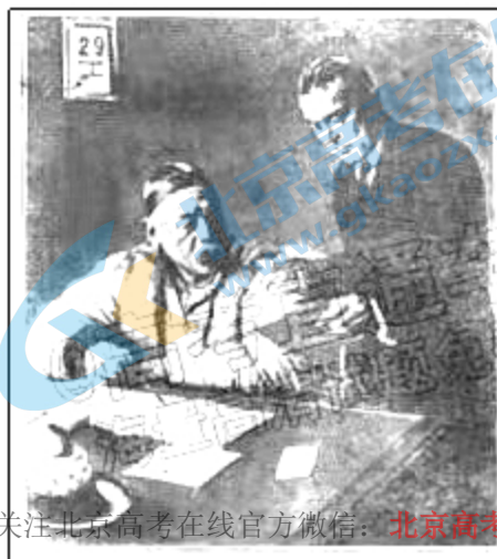
图 2 是 1912 年 8 月 31 日英国《插图伦敦新闻》封面画，图注是“中华民国第一任总统（原文如此）的政治顾问莫理循博士和总统袁世凯”。莫理循是澳大利亚籍英国《泰晤士报》驻华记者，当时被西方媒体誉为“舵手”“拯救中国的教皇”。他后来回忆说：“许多图片新闻刊载有我的画像，最有趣的是伪造我站在袁世凯身旁并以一份文件请其过目的那张画像。这是总统和他的秘书蔡廷干的照片，不过蔡的头被我的头取而代之。”