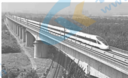
2017 年,中国制造的时速达 350 千米的标准动车组“复兴号”