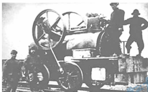
1814 年的第一台蒸汽机车,中国制造

2. 1814 年,世界上最早的蒸汽机车研制出来,它丑陋笨重,走得很吃力,有人驾着马车与它赛跑,并讥笑说:“火车怎么还没有马车快呀?”火车饱受世人嘲讽。200 多年后,马车仍按原速转动着它的轮子,火车却在飞速前进着……今天,时速达 350 千米、安全快捷、平稳舒适的高速列车已经成为人们出行的重要交通工具。