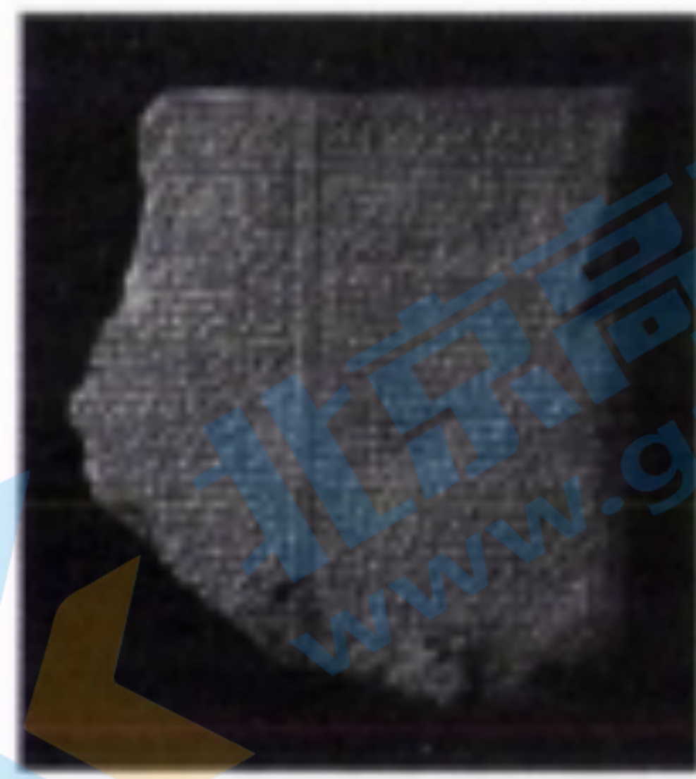
图 3 公元前 7 世纪亚述王室图书馆馆藏标准巴比伦语版史诗残片