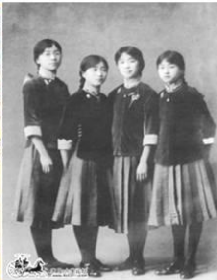
图 2 1916 年，林徽因与表姐妹们的合影 她们身上穿的是北京培华中学校服

比较图 1、图 2，提取两项有关中国女性从古代社会向近代社会变迁的信息，并结合所学知识予以说明。