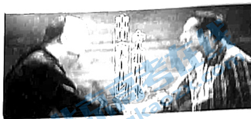
节目中李贽与袁隆平 跨越400多年的“握手”