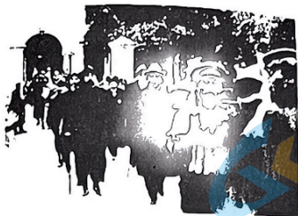
图4: 李大钊、孙中山从会场走出的照片, 1924年1月摄于广州